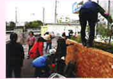
「花いっぱい運動」、美化活動