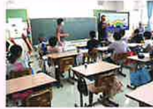
市内小学校/ 五色百人一首クラブ指導