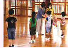
交通安全マスコット贈呈式 (市内全小学校)