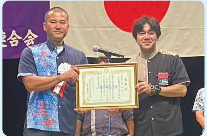
【新規加入部員部門】 1位

去る、5月13日（月）に沖縄県商工会青年部連合会通常総会が名護市民会館にて開催されました。そこで豊見城市商工会青年部は上記の内容にて表彰を受けました。