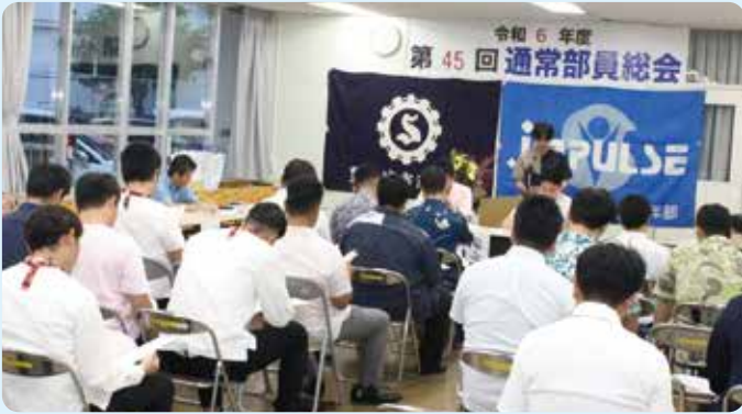
総会の様子、皆さん真剣に耳をかたむける！

去る、4月24日（水）に通常部員総会が開催され、令和5年度事業報告及び収支決算書、令和6年度事業計画書及び収支計画書、役員の新補充選任の各議案が満場一致で可決承認されました。令和6年度の重点事業としては、①組織の維持と資質向上の推進②青年部広報活動の強化、③福祉、ボランティア活動の推進、④地域社会貢献事業の推進、⑤親睦事業の推進、⑥研修事業の推進を行います。