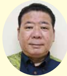
理事 長嶺照 印刷センターテル