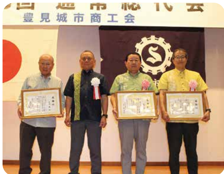
上原会長と感謝状受賞者の方々