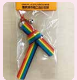
交通安全マスコット

豊見城市商工会女性部では、交通安全の啓蒙を促すことを目的に、市内全8校の新一年生を対象に交通安全マスコット配布を行っております。約1年をかけて女性部が交通安全を祈願して、毎年約1,000個のマスコットを手作りしています。25年前から始まり、これまで累計約2万5千個を制作しました。これからも、豊見城市商工会女性部は地域振興発展の推進力となります。