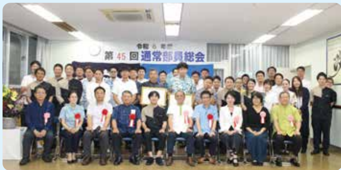
今年も無事総会終了！

会員の皆様には、今後も引き続き青年部活動へのご支援ご協力を賜りますようお願い申し上げます。