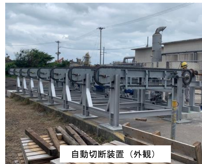
自動切断装置（外観）