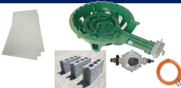
①不燃ボード60×60 2枚 ②ブロック3個 ③ガス窯④調整器具・ホースセット