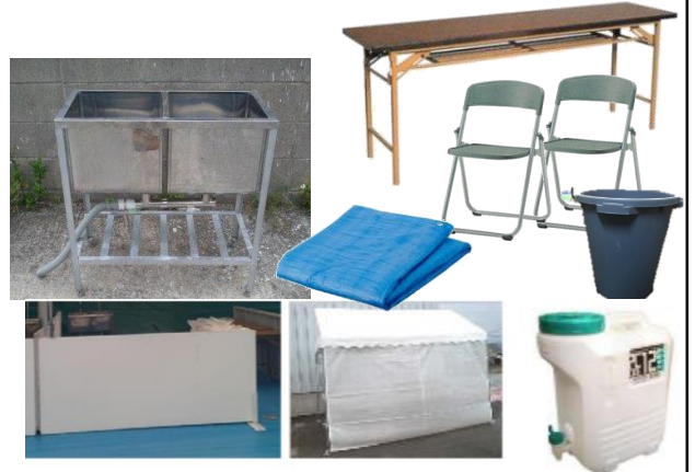
①テーブル45×180 1枚②折イス 2脚 ③腰壁 (H900) / ※前面のみW2400 ④2層シンク ⑤ブルーシート(地面養生) ⑥メッシュ幕 ⑦排水バケツ1個 ⑧給水用ポリタンク (12 L) 2個