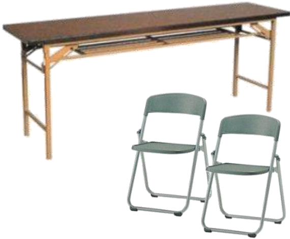
①テーブル45×180 1枚②折イス 2脚