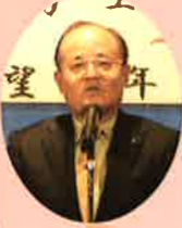
来賓挨拶: 連天副会長