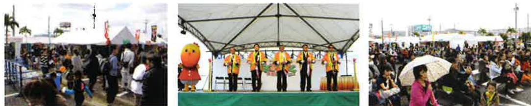
写真は前回の開催風景です。