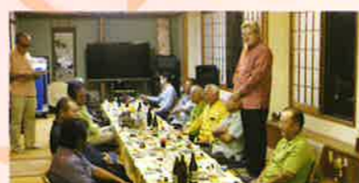
伊是名村商工会との交流