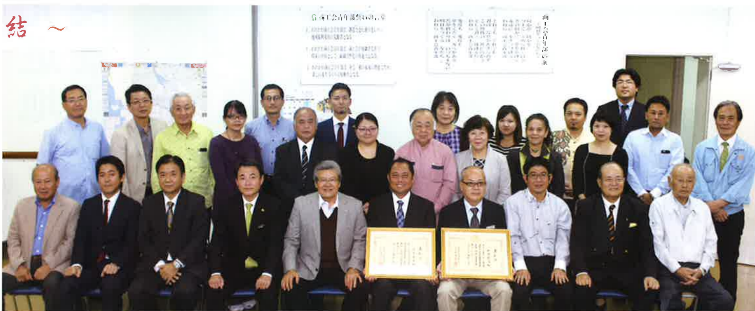
平成29年度受賞者祝賀会及び役員職員忘年会