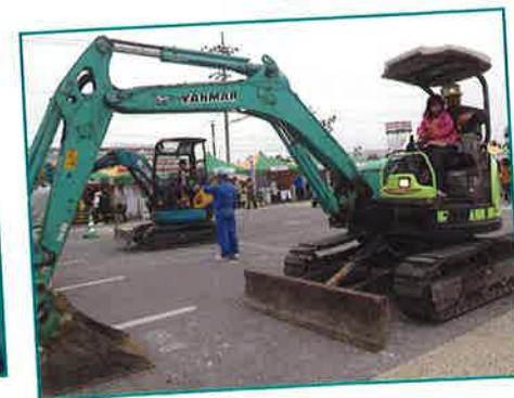
***写真は前回の開催風景***