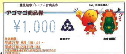
▲商品券のイメージ

購入方法 各世帯に送付する「購入案内ハガキ」をご持参のうえ下記の販売場所にお越しください。 (購入案内ハガキの各世帯への発送は8月中旬頃を予定しています。発売日までにハガキが届いていない場合はお手数ですが下記の連絡先にご連絡ください。)